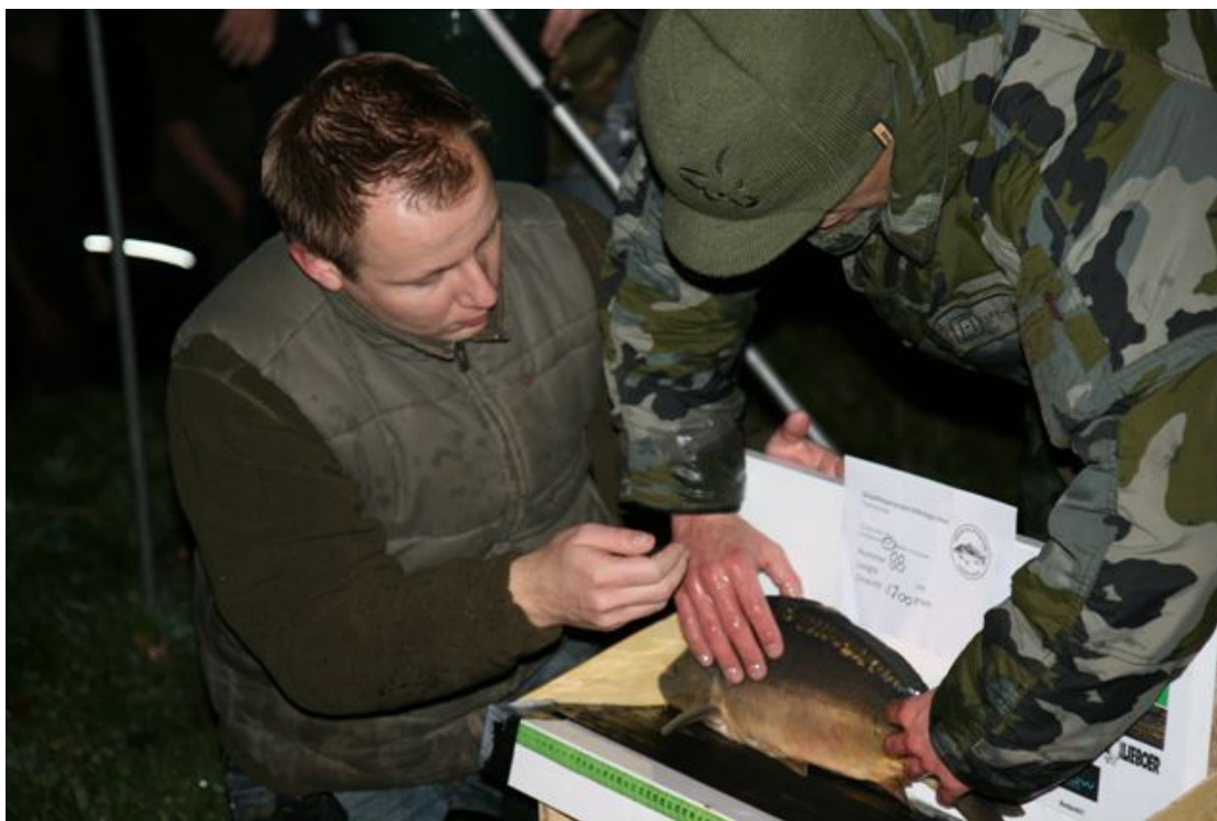
Het meten, wegen en fotograferen van de uizetspiegelkarpers vormt de basis van een succesvol gemonitord SKP

Zoals afgesproken met de betrokken instanties zijn alle uitgezette vissen gemeten, gewogen en gefotografeerd. Deze gegevens zijn opgeslagen in de database van het SKP om zo de volledige monitoring van terugvangsten mogelijk te maken.