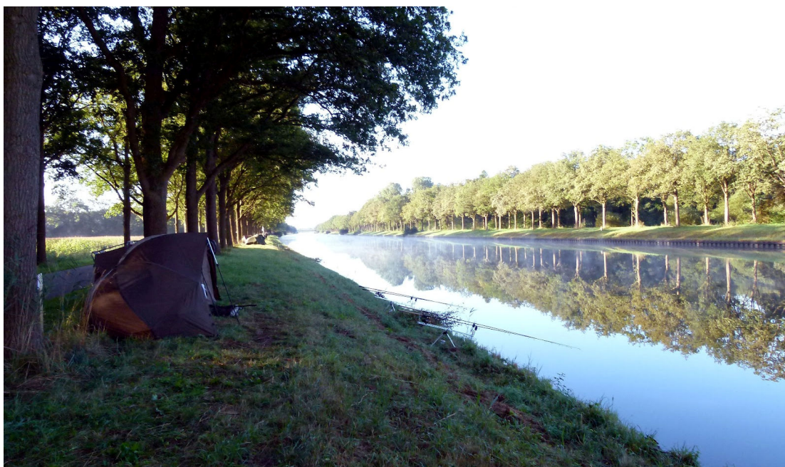
De NTK aan het Twentekanaal

Overigens zijn er naast de NTK nog verschillende andere karperwedstrijden op het Twentekanaal. Leuk om te vermelden in deze context is dat 3 van de terugvangsten op TK1 van wedstrijden afkomstig zijn!